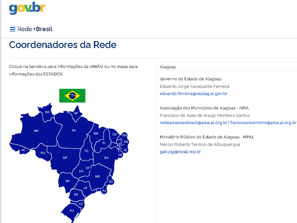
Dados: plataformamaisbrasil.gov.br/rede-brasil (Dez- 2020)

❖ É uma rede de governança colaborativa para o desenvolvimento de ações voltadas à melhoria dos processos de gestão das transferências da União, por meio da Plataforma +BRASIL, antigo Siconv.