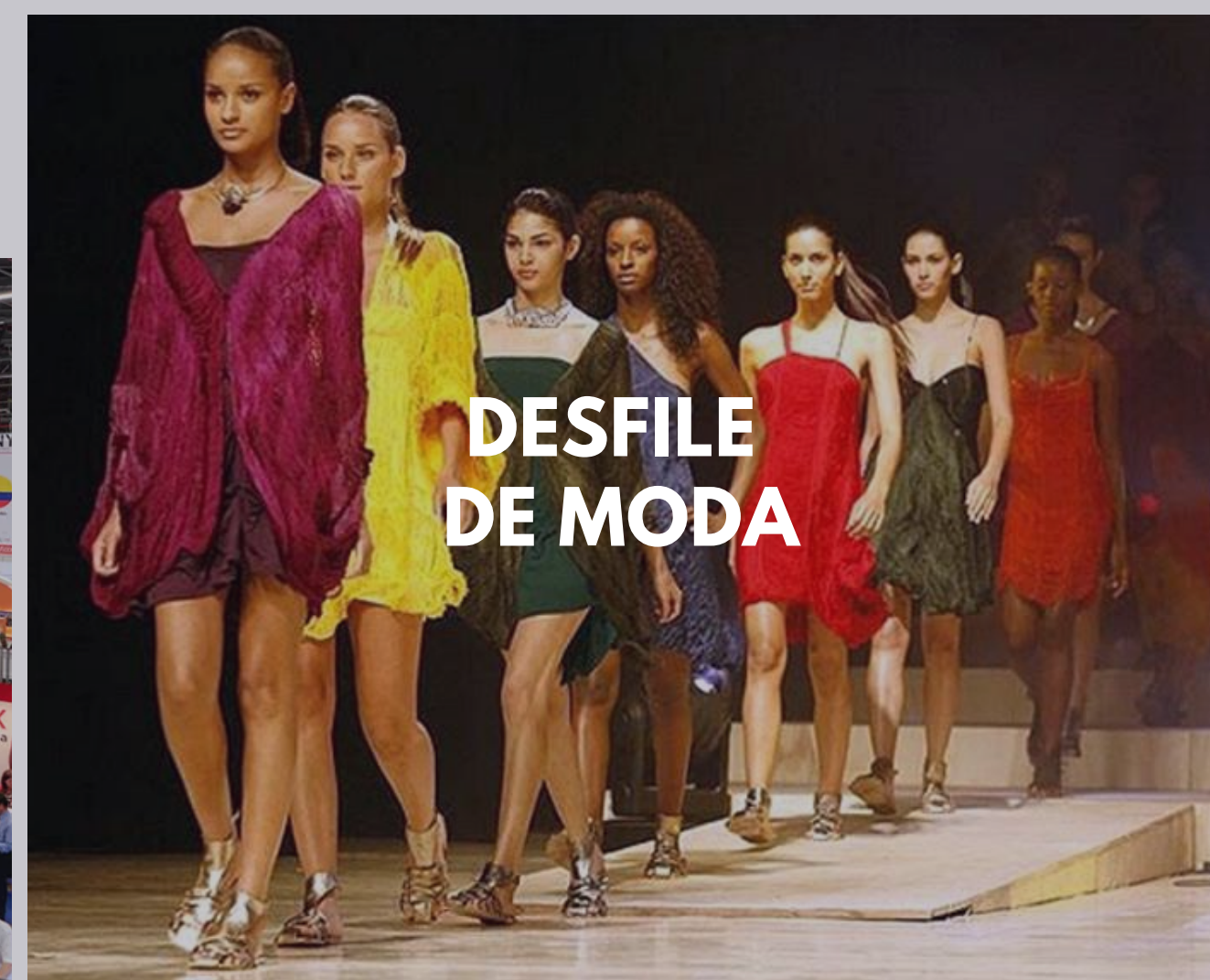
DESFILE DE MODA