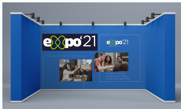
Stands de Divulgação