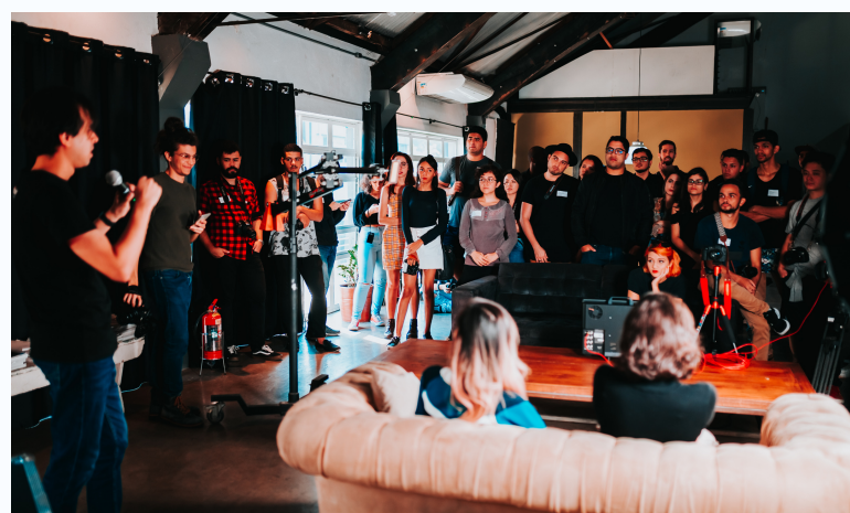
Ministrar oficinas e palestras