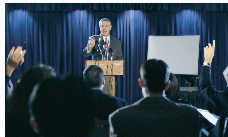
Menção durante as atividades