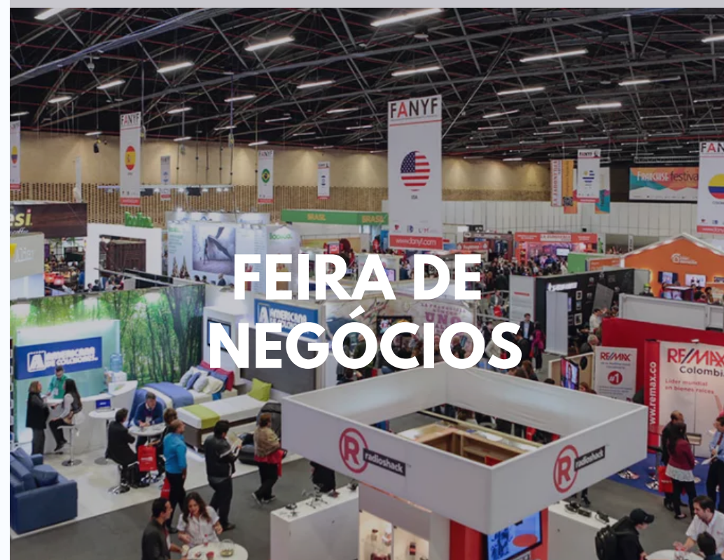
FEIRA DE NEGÓCIOS